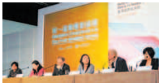
■第一屆微電影論壇