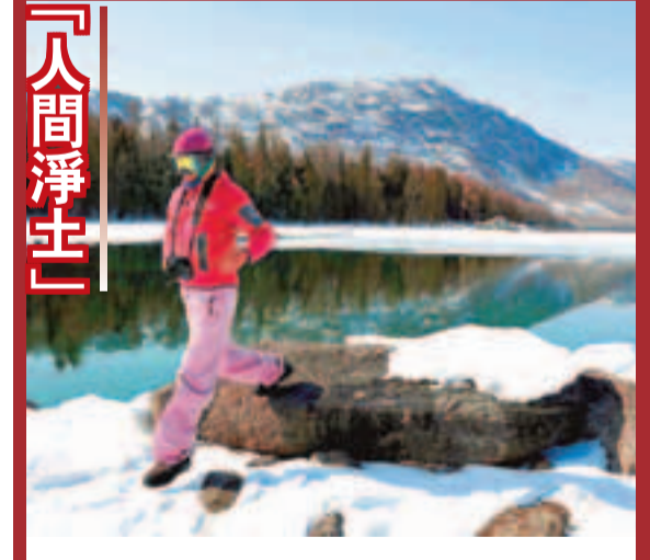
3月末，在新疆北部被譽為「人間淨土」的喀納斯景區，仍是一片銀裝素裹，北國風光。絕美的景色，以及適宜的氣溫，吸引遊客到此暢遊其間，如同畫中行。 ■中通社