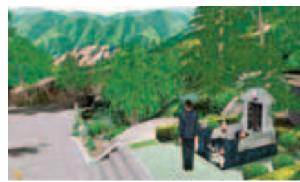
■網絡掃墓。網上圖片

清明節日益臨近，網上的各大「網絡陵園」也開始陸續的迎來網絡祭祀的高峰。記者調查發現，越來越多的人開始通過為親人在「網絡陵園」設陵墓、發祭文等方式來祭奠逝去的親人，在虛擬的世界裡寄託對親人真實的思念。