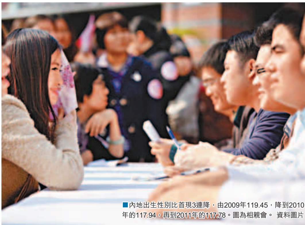
■內地出生性別比首現3連降, 由2009年119.45, 降到2010年的117.94, 再到2011年的117.78。圖為相親會。資料圖片

有專家指出, 出生性別比偏高問題, 實質上是女性發展權益問題。目前, 內地女性除教育程度增長的幅度基本與男性持平外, 其它指標都明顯落後。女性雖然廣泛參與社會勞動, 但職業聲望和收入不高。官方認為, 從源頭上預防「兩非」行為, 應改善女孩生存和發展環境。在全國開展的關愛女孩行動, 則是通過建立行為約束機制、利益導向機制, 制定有利於女孩成長及其家庭發展的社會經濟政策和社會保障制度。