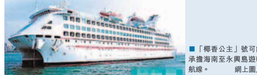
「椰香公主」號可能承擔海南至永興島遊輪航線。

尹卓說,一個國家是否有權擁有島嶼,還包括在島上是否有足以維持駐島人員生存的生產活動。