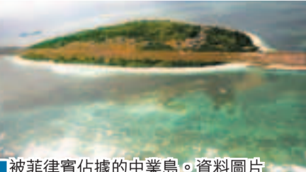
被菲律賓佔據的中業島。資料圖片

香港文匯報訊 環球網消息:美聯社28日於馬尼拉報道稱,菲律賓方面無視中國的抗議,宣稱將會繼續在南海被菲律賓軍隊實際佔領,但中國聲稱擁有主權的島嶼上建造渡運碼頭。