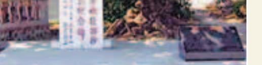
在永興島上的收復西沙紀念碑。

島上植物種類多,野生的有148種,佔西沙群島總數的89%,尤以麻風桐著名。還盛產椰子、木瓜、香蕉等水果、20多種蔬菜、雜糧。該島處西沙群島中央,位置優越,四周有良好地,風浪小,是興建碼頭的良好地點,已修建300米可停泊3,000噸級船隻的碼頭。