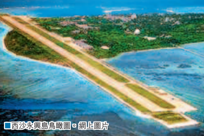
西沙永興島鳥瞰圖。

香港文匯報訊(記者 肖茅 海口報導)為強化對南海諸島主權,中國計劃今年內開闢海南島與西沙群島最大島—永興島之間的遊輪航線。