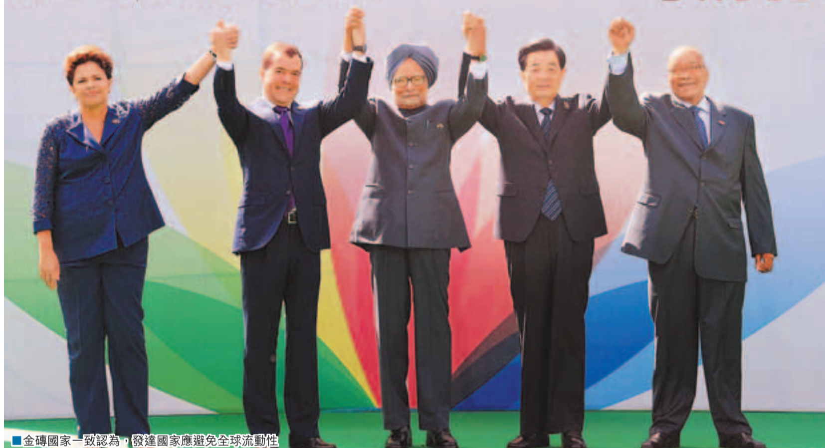
金磚國家一致認為,發達國家應避免全球流動性過剩,採取負責任的宏觀經濟和金融政策。新華社

FOURTH BRICS Summit March 29, 2012 : New Delhi