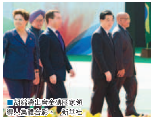
胡錦濤出席金磚國家領導人集體合影。

胡錦濤在會上發表題為《加強互利合作,共創美好未來》的重要講話,就加強金磚國家合作提出四點建議。第一,堅持共同發展,促進共同繁榮。堅持辦好自己的事情,保持經濟增長、民生改善的良好勢頭,這本身就是對世界經濟復甦和增長的重大貢獻。第二,堅持平等協商,深化政治互信,充分照顧彼此重大利益和關切,成為國際上相互尊重、平等協商的典範,永遠做好朋友、好夥伴。