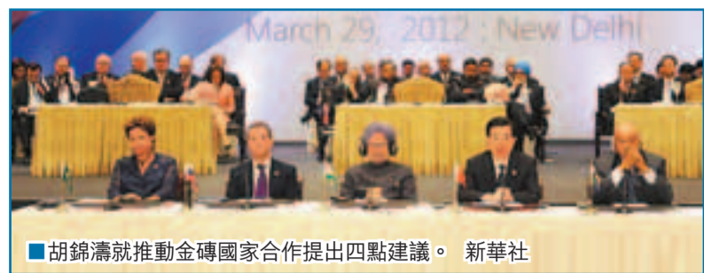
胡錦濤就推動金磚國家合作提出四點建議。