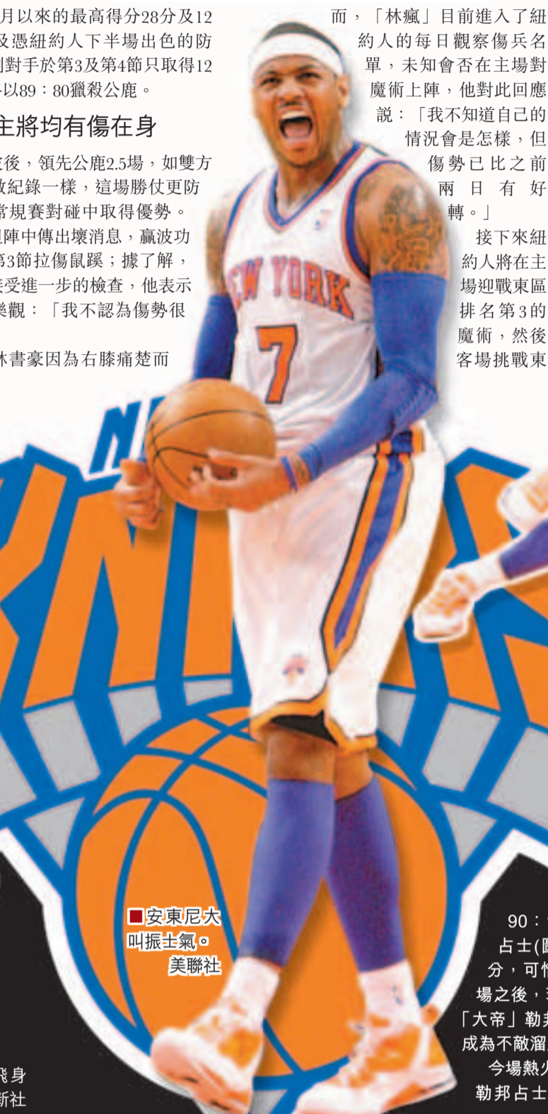
■安東尼大叫振士氣。