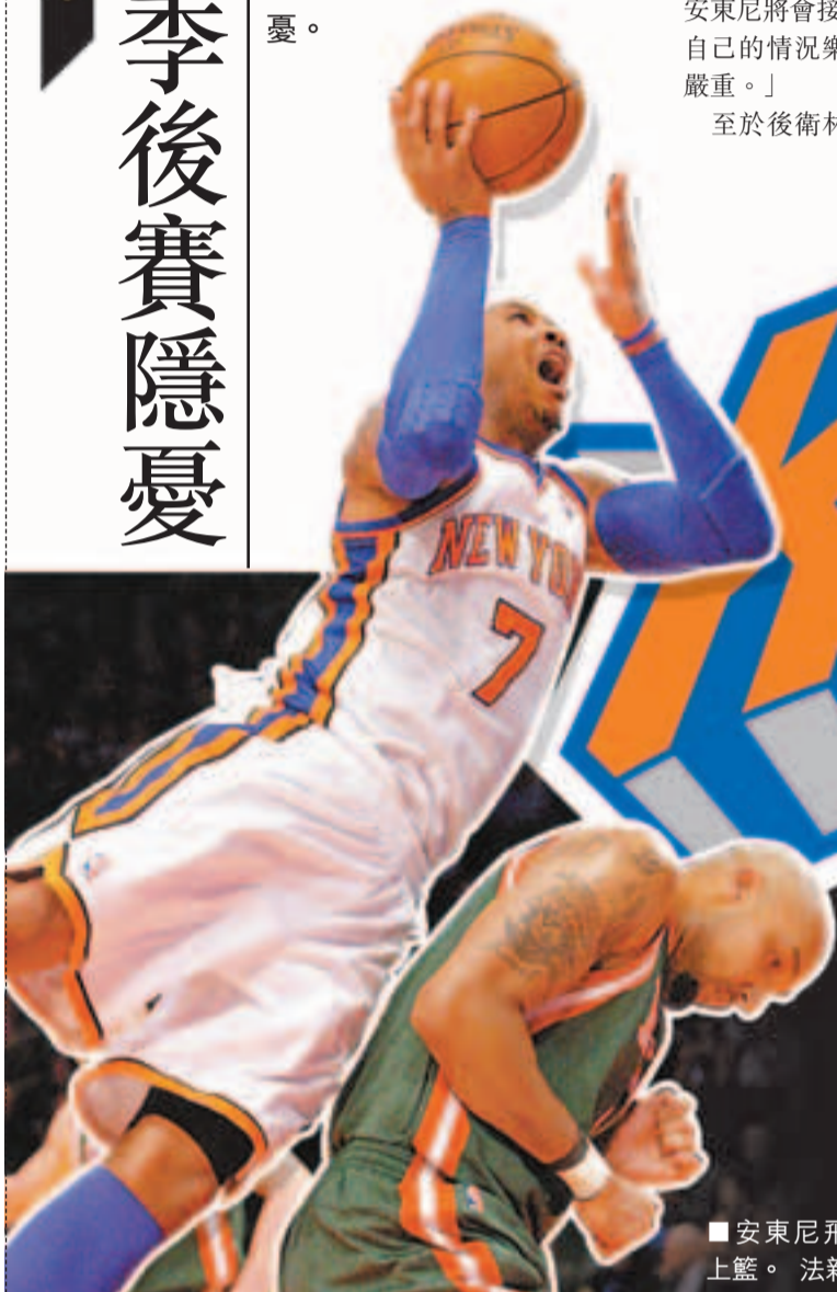
■安東尼飛身上籃。

●now678台7：00a.m.直播 ○now635台7：00a.m.直播 註：直播時間以電視台公布為準