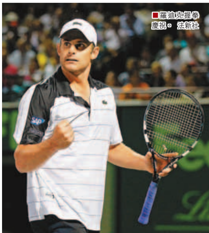
■羅迪克握拳慶祝。

網壇「3哥」費達拿在香港時間周二於邁阿密公開賽第3圈意外出局，他以盤數1：2不敵羅迪克；羅迪克結束「瑞士天王」在二人對賽上的16連勝紀錄，亦打破費達拿對戰排名20位外選手的77場連勝紀錄。(now636及高清660台周三2:30p.m.直播當日賽事)