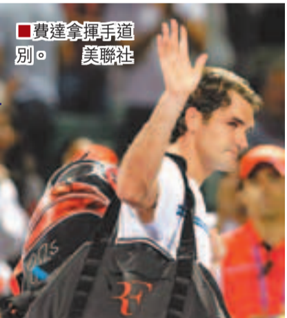
■費達拿揮手道別。