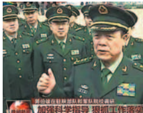
中央軍委副主席郭伯雄近日在駐陝部隊調研。

講話。其中「從嚴治軍」、「意識形態領域鬥爭尖銳複雜」、「保持部隊自身安全穩定」等吹風表態引發關注。而中央軍委副主席郭伯雄的表態更加明確和直接,近日他在駐陝部隊調研時公開稱,要繼續抓好維護社會穩定和搶險救災有關準備工作,「確保一旦有事,能夠迅速行動,堅決完成任務」。