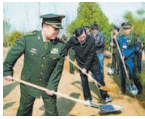
26日,郭伯雄與軍方高層集體「亮相」參加植樹勞動,被認為有顯示團結之意。

另據官方媒體報道,3月26日,郭伯雄與中央軍委委員梁光烈、陳炳德、李繼耐、廖錫龍、常萬全、靖志遠一同參加植樹勞動。軍方高層集體「亮相」被認為有顯示團結之意。