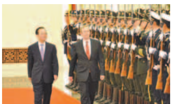
溫家寶昨日在京為來訪的愛爾蘭總理肯尼舉行歡迎儀式。

安南發言人昨日傍晚在北京發表聲明,指敘利亞政府致信安南,表示將接受安南在聯合國安理會支持下提出的六點計劃。安南在給阿薩德總統的回信中敦促敘利亞政府盡快履行承諾。