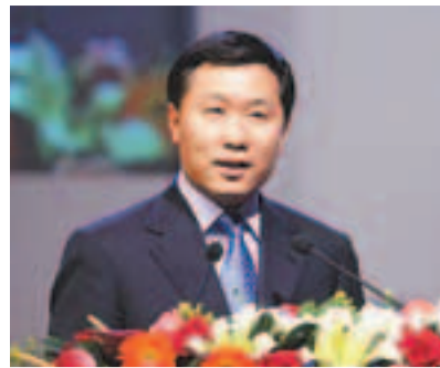
■中國證監會副主席姚剛認為,中國企業債券融資發展相對滯後。

香港文匯報訊(記者 古寧 廣州報道) 中國證監會副主席姚剛25日在廣州參加首屆嶺南論壇時表示,希望今年上半年能夠推出高收益企業債。目前,中國證監會正在對發債主體、投資者、中介機構進行需求調研,研究中小企業發行私募債券的方案。