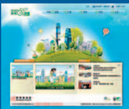
■新地推出全新「新地G能量」網站,讓大眾了解集團於環保方面的最新動向。

新鴻基地產(新地)向來重視環保,將可持續發展理念融入物業發展各環節,積極支持及舉辦各類愛護地球的活動,更推出全新「新地G能量」網站(www.shkpGpower.com),讓大眾了解新地於環保方面的最新動向。早前新地便透過旗下龐大的物業網絡,回收近5,000份新春食品及禮品轉贈有需要人士,將環保理念推展開去。