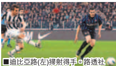
■迪比亞路(左)掃射得手。