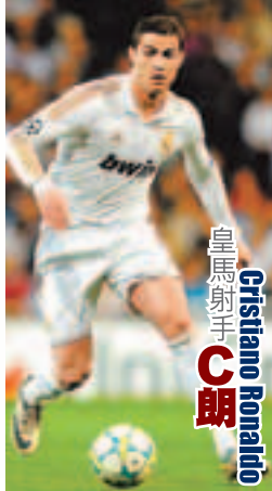
皇馬射手 C朗 Cristiano Ronaldo