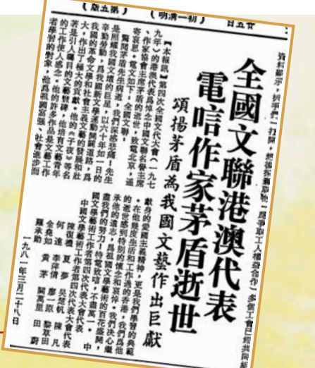
全國文聯港澳代表 電唁作家茅盾逝世

歷史上的今天 1981年3月27日，中國現代文學家茅盾逝世。茅盾是在國內外享有崇高聲譽的著名作家。他同魯迅、郭沫若一起，為中國革命文學和文化活動奠定了基礎。在他60多年的文學生涯中，創作了《子夜》、《蝕》、《虹》、《春蠶》、《林家鋪子》、《霜葉紅似二月花》、《清明前後》等大量傑出的文學作品，描述了中國民主革命的艱苦歷程，豐富了中國文學寶庫，提高了現實主義文學創作的水平，在現代文學史上留下了不可磨滅的功績。