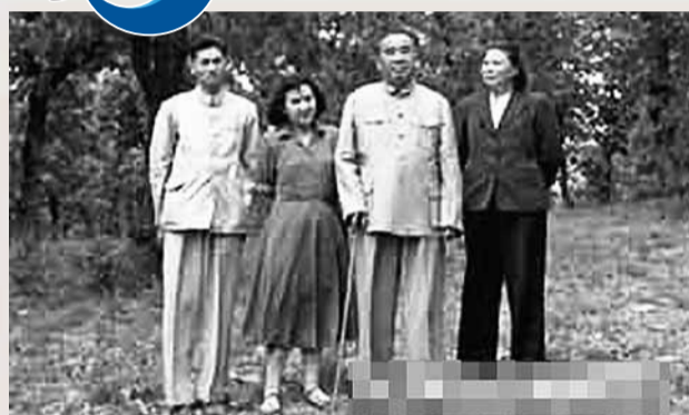
朱德與夫人、女兒、女婿。網上圖片

2011年10月25日，在長城腳下，晚秋是北京郊外，劉建兄弟三個聚集一堂——劉建、劉敏、劉武。他們的母親是朱敏，朱德元帥唯一的女兒；而在「爺爺」朱德眼裡，他們是留在身邊的孫兒們。30多年過去了，在孫兒們眼中，與朱德元帥一起的日子，其實並不遙遠。