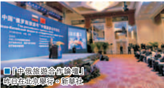
「中俄旅遊合作論壇」昨日在北京舉行。