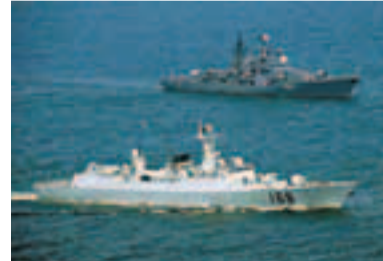
中俄海軍將舉行聯合演練。