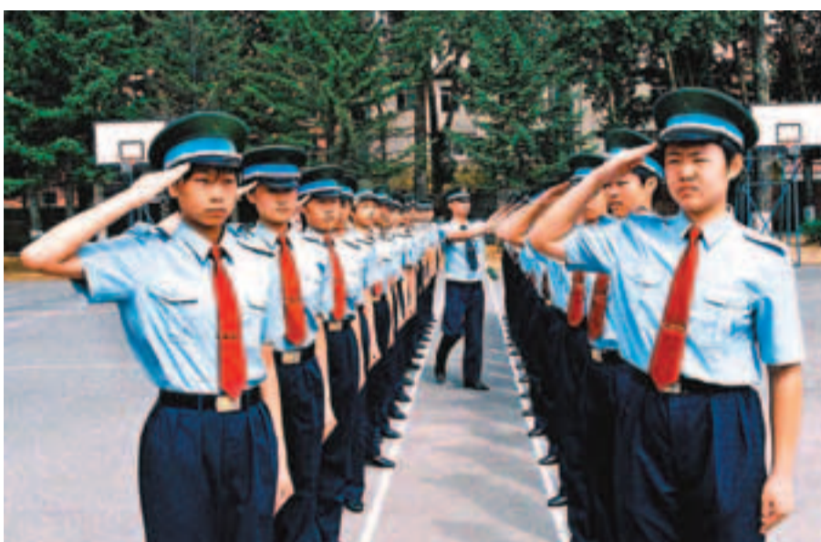
2005年夏季，中國第八批女飛行員跨入空軍航空大學，從此拉開中國首批女航天员培訓的序幕。