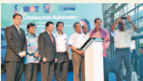
中國南車董事長趙小剛(左一)與馬來西亞交通部長江作漢(右二),馬來西亞副首相慕尤丁(右四)等見證列車上線。

香港文匯報訊(記者 譚錦屏)由南車株機自主研製的高端城際動車組首次「走出國門」,在馬來西亞吉隆坡城際線批量上線運營。馬來西亞副首相慕尤丁日前親自為列車上線剪綵並乘車體驗。