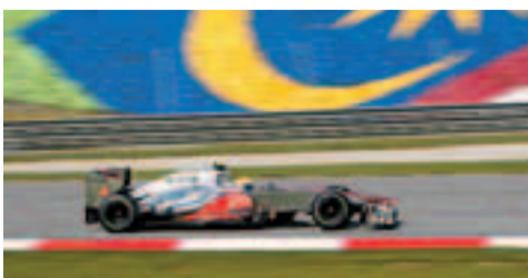
威美頓連續兩節練習均做出最快時間。