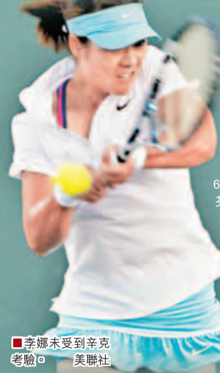
李娜未受到辛克考驗。

亞洲一姐李娜周四在邁阿密公開賽女單次圈賽事，以7:5和6:2的盤數擊敗匈牙利老將辛克，順利晉級第3圈，職業生涯累積第400場單打勝利，將職業生涯的戰績改寫為400勝154負。李娜在第3圈的對手將是來自捷克的比妮蘇娃。另外2名中國金花彭帥和張帥則悲喜參半，彭帥只需61分鐘，便以6:1和6:2的盤數輕取法國球手斯特芬妮，張帥則以總盤數0:2不敵前「世界一姐」、美國球手莎蓮娜威廉絲(細威)。