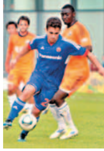
利馬(左)提早收咧對南華影響甚大。 資料圖片