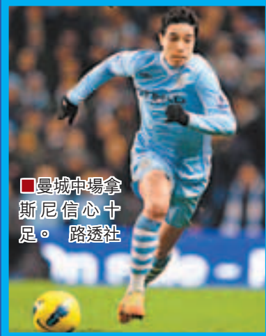
■曼城主場拿斯尼信心十足。

曼城剛在英超重開勝門，今晚聯賽只要擊敗史篤城，便可暫以2分優勢重返榜首，不過曼城今季作客發揮一般，史篤城最終若在主場成功爆冷取分亦不出奇。(有線300台及200高清台周日凌晨1:30a.m.直播)