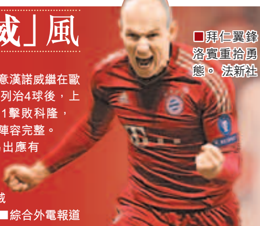
■拜仁翼鋒洛賓重拾勇態。