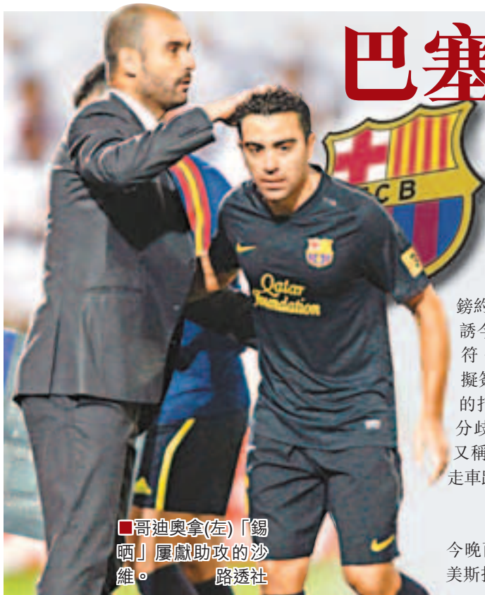
■哥迪奧拿(左)「錫晒」屢獻助攻的沙維。

英超車路士炒掉領隊波亞斯後，一直有傳聞主艾巴莫域治有意向巴塞羅那的冠軍教頭哥迪奧拿及法國國足主帥白蘭斯招手。最新英國《太陽報》稱，藍軍有意為哥帥開出稅後總值4000萬英鎊(1英鎊約合12港元)的4年天價合同，以誘今夏離巴塞約滿的哥帥接掌兵符。有指哥帥認為巴塞主席羅素擬簽前鋒尼馬的計劃會影響巴塞的打法與更衣室氣氛，恐會因這分歧而離開巴塞。《每日郵報》又稱，巴塞準備出3500萬英鎊挖走車路士巴西中堅大衛雷斯。