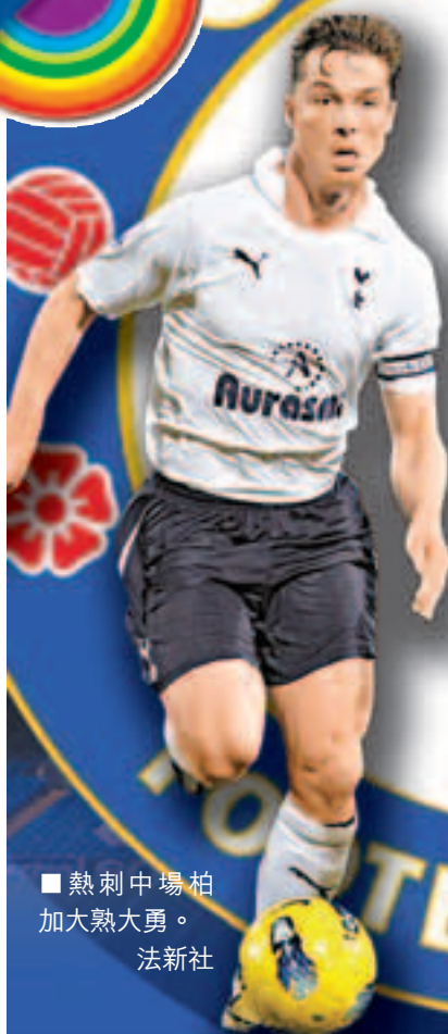
■熱刺中場柏加大熱大勇。

熱刺到英超中後段後勁不繼，由在第3位領先10分到被阿仙奴搶去季席。今晚第30輪聯賽，熱刺要作客他們的「凶地」史丹福橋球場，火拚在第5位緊隨其後的倫敦同市勁敵車路士，隨時有機會再敗一場，壯大車仔後上搶走來屆歐聯資格的信心。(有線300台及200高清台今晚8:45p.m.直播)