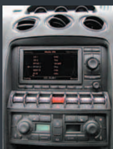
中控台配備綜合式多媒體系統，提供駕駛樂趣以外的多項功能。