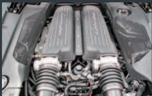
5.2公升直接噴注V10引擎輸出強勁