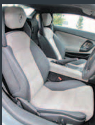
以真皮及麂皮製作的桶形雙色座椅承托力出色