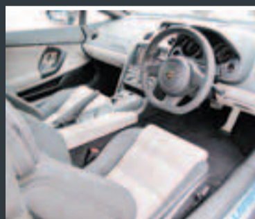
車廂陳設保持了Gallardo的原有設計風格

Gallardo LP560-4 Noctis依然沿用5.2公升直接噴注V10引擎，最大馬力輸出高達560ps/8,000rpm，而扭力亦高達55.1kgm/6,500rpm的強大數值，當然老拍檔的E-Gear六前速加減自動波箱同樣為它效力，提供迅速敏捷的轉檔反應。此外，Gallardo一直沿用的四輪驅動系統依然被保留，令行車表現更加得心應手，它的四驅系統力量分佈比例是前30後70，好讓Gallardo有着中置引擎後輪驅動的跑車風格，加上有電子輔助系統的幫助，完全可約束高速行車時出現甩尾的關鍵性表現。另外，新車設定的懸掛系統上，吸震筒和螺旋彈簧也加強了抓地性能，加上了空氣動力學的調節，在迴避力、操控和高速穩定性都有着出眾表現；而其操控表現更是無出其右，讓駕駛者不需要有太高深的駕駛技巧，也能享受到全面的超級跑車真正樂趣。