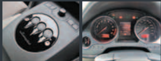
E Gear六前速加減自動波表現成熟 傳統錶板簡單清晰

近日，代理商Lamborghini Hong Kong再度為Gallardo車系增添一員猛將，引進全新Gallardo LP560-4 Noctis型號，以壯大車系的強勁聲勢。