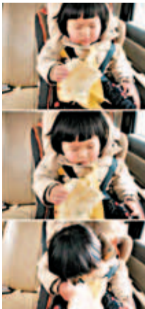
蘇州兩歲「瞌睡妹」萌翻網友。