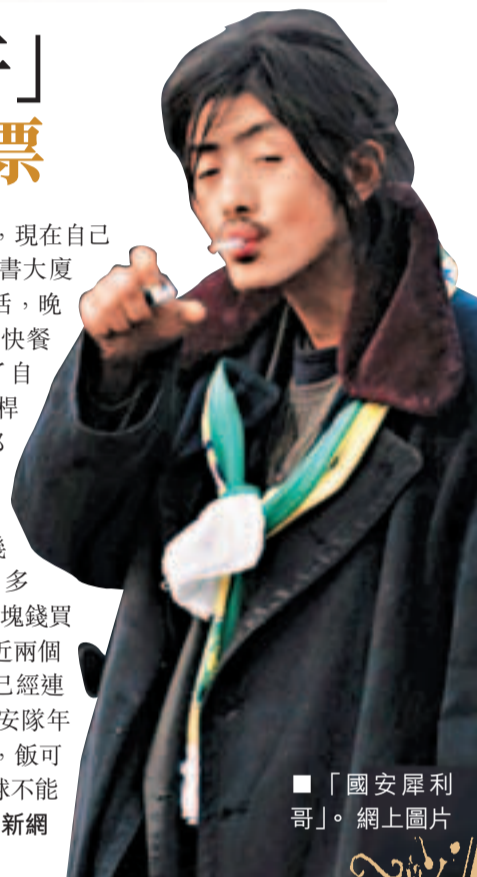
「國安犀利哥」。網上圖片