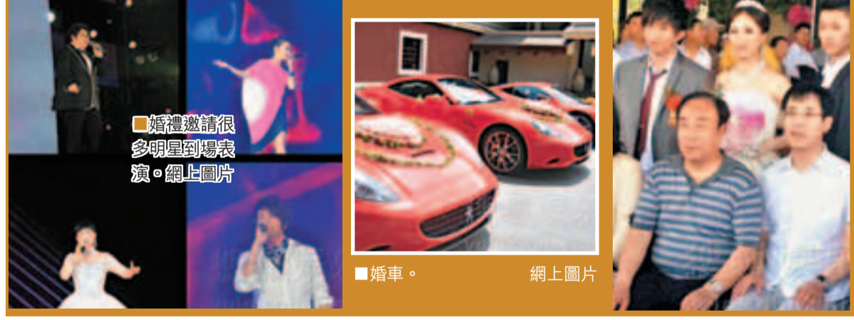
婚禮邀請很多明星到場表演。