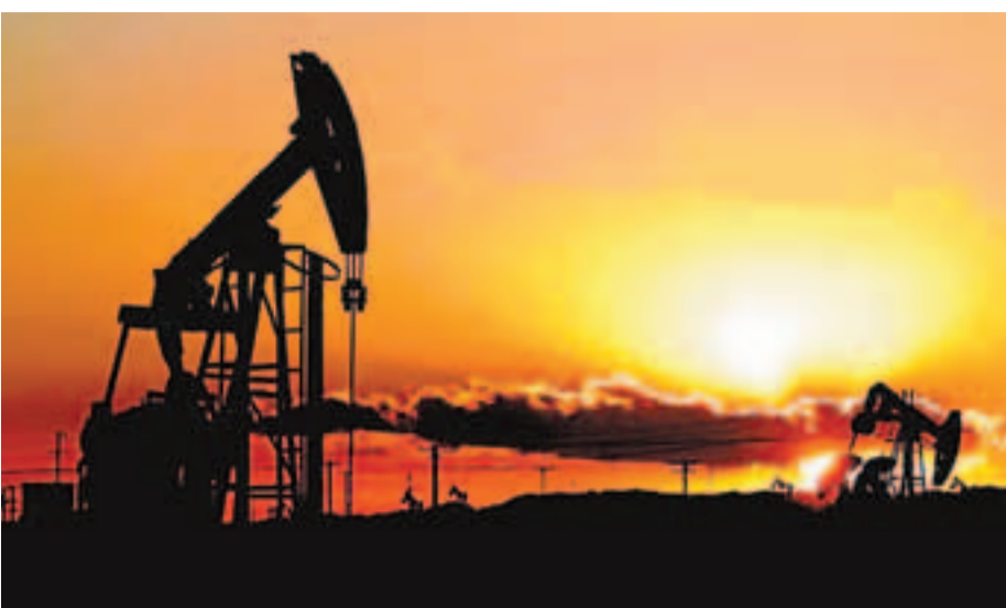
■新疆化工行業五年欲投2700億元打造中國三大生產基地、三大儲備基地。資料圖片 建立伊犁、準東、庫一拜、和一克煤化工底,新疆化工行業共有規模以上獨立核算的企業287家,其中大中型企業49家,從業人數8.7萬餘人。