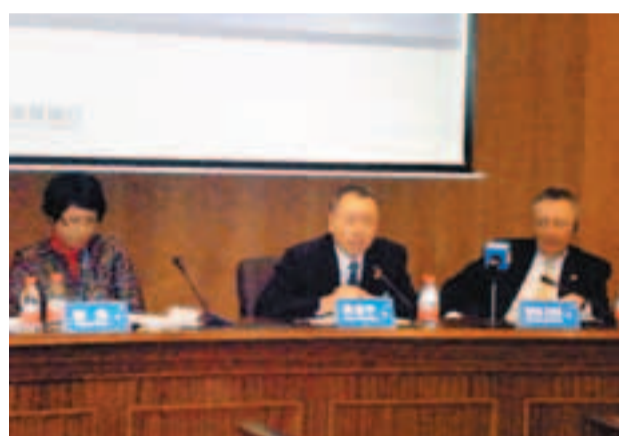
■深發展行長理查德(右一)表示,明年一季度將完成與平安銀行全面整合。

香港文匯報訊(記者 李昌鴻 深圳報導) 深圳發展銀行行長理查德·傑克遜近日接受記者採訪時表示,該行將於明年一季度完成與平安銀行的全面整合。在談到深發展去年不良貸款上升16%時,他表示,主要是江浙和珠三角製造業中小企業陷入困境的拖累,目前他們逐項審查溫州的不良貸款,以控制風險。