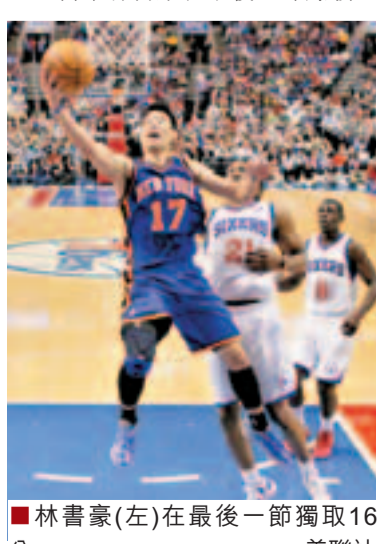
林書豪(左)在最後一節獨取16分。

換了主帥的紐約人迎來重生，周三作客以82:79力挫大西洋組榜首76人，當中林書豪在最後一節爆發，獨取全隊該節23分中的16分，為暫代主帥活臣贏得5連勝。