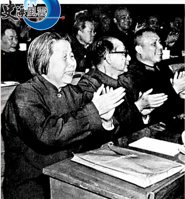
擔任全國人大副委員長後，鄧穎超盡自己的所能努力工作，在四年的任期裡幹得相當出色。

對於這家購物廣場的行為，律師唐明認為，所謂冒牌貨或者假貨，在法律上並沒有具體界定。平常說的假貨，其實就是侵犯別人商標專利、或者商品的外觀設計及其他合法權益的產品。唐明認為，我國商標法規定，使用未經商標所有權人授權的相同商標或者近似商標的行為，屬於商標侵權。