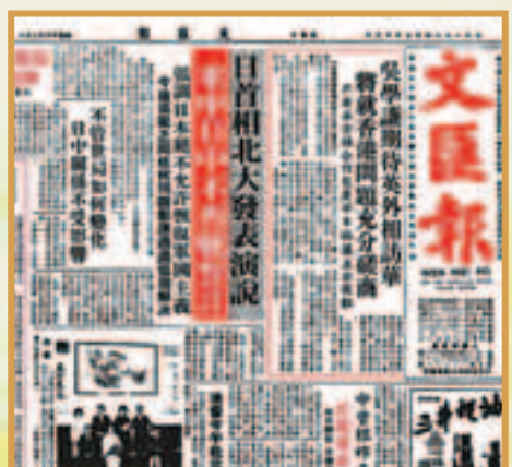
1984年3月23日，日本首相中曾根訪華。 網上圖片