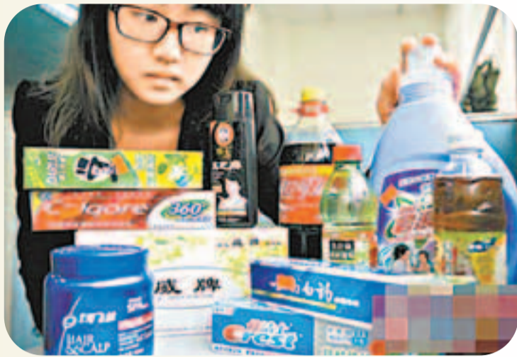
從港潤購物廣場買回的「高仿」雜牌貨。

記者進一步調查發現，這個超市的實際經營者已更換為「歐記清貨公司」，但不少顧客並不知情，以為還是原來的港潤超市。