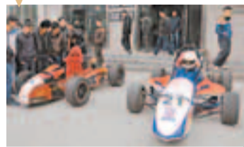
學生手工打造的「F1賽車」。

▲香港文匯報訊(記者李陽波、實習記者王磊西安報道)日前，西安某汽車學院一個由12名學生組