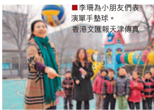
香港文匯報訊(記者 李欣、通訊員 朱寶琳天津報道) 天津大學幼兒園60周年校慶之際，奧運冠軍、前中國女排主力隊員李珊來到這裡，與小朋友們互動交流。在接受記者採訪時

李珊表示，對全運會復出有心理準備。重返闊別20年的幼兒園，李珊對這裡的一草一木仍感到熟悉和親切。她回憶說：「那時候我們跳繩達到10個就是『優秀』，但是我只能跳很少幾個。於是我就周末回家練習，再回到幼兒園就一口氣跳了20多個，老師都很驚訝。」李珊說，是天津幼兒園給了她最早的體育啟蒙。 在操場上，李珊為小朋友表演了單手墊球，還手把手地教小朋友們排球動作。她說，希望能有更多的孩子投入到排球事業中去。 重掌天津女排的王寶泉，目前已確定了球隊的全運會目標——保三爭冠。在他的全運計劃中，初步預想是讓李珊復出，重新打接應的位置；老將李娟則改打主攻位置。但由於李珊目前在中國女子水球隊擔任領隊助理，工作一直要持續到倫敦奧運會之後，因此是否復出也要奧運會後再商討。 談及復出問題，李珊表示，在隊伍最困難的時候，自己作為老隊員有責任幫助球隊渡過難關，畢竟排球是自己的事業，她會把團隊的利益放在第一位。