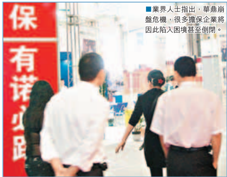
■業界人士指出，華鼎崩盤危機，很多擔保企業將因此陷入困境甚至倒閉。

據相關企業初步聯絡登記材料顯示，華鼎、創富貸款金額多數在400萬元至1,000萬元之間，高的有1,500萬元，少的也有140萬元，而其中有一半左右的企業來自用的貸款為零，貸款委託給了華鼎或者創富進行理財，利息高達12%。58家企業貸款總額為4.1505億元，其中企業實際自用的貸款資金僅為6,165萬元，將近85%的資金被華鼎和創富圈走。牽涉的銀行則有工行、中行、農商行、廣發、交行、國開行等。