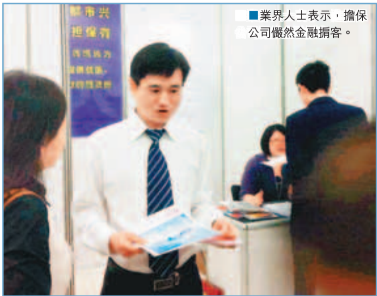
■業界人士表示，擔保公司儼然金融掮客。