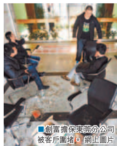
■創富擔保東莞分公司被客戶圍堵。

華鼎日前向廣東省金融辦匯報時透露，其資金缺口是19億元，19億元的資金主要流向了香港兩家上市公司以及美國的一家公司。公開資料顯示，陳奕標投資了香港上市公司泰潤國際投資有限公司、香港上市公司嘉馮國際(2011年8月更名為中國投融資集團有限公司)，並在美國投資成立了一家名為「亞瑟爾資本」的公司。但這些投資並不成功。而來自企業方面的初步統計是，華鼎挪用了400多家企業貸款共約17億元。被華鼎和創富挪用於理財的資金就達11.5億元，其中有1.6億元屬於企業自有資金交給華鼎和創富「理財」，其餘的9.9億元屬於從銀行貸款中截留。