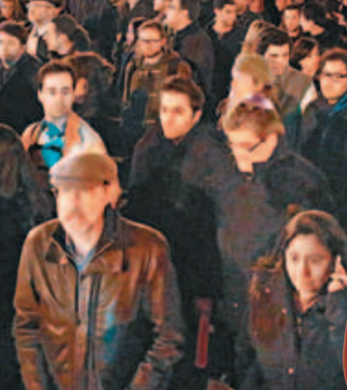
■巴黎2萬人上街悼念死者。