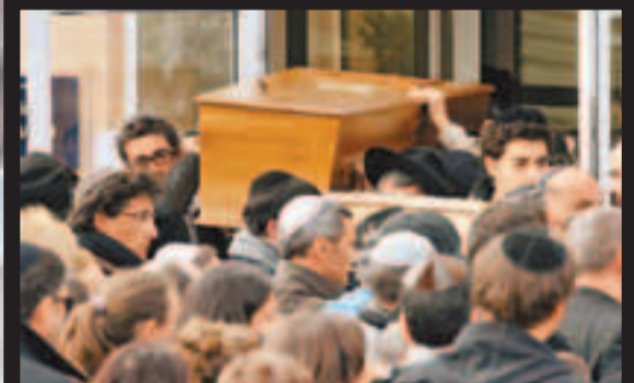
■4名死者的遺體昨日從學校運走，返回以色列下葬。