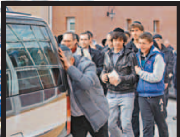
■親友擁着靈車泣不成聲。