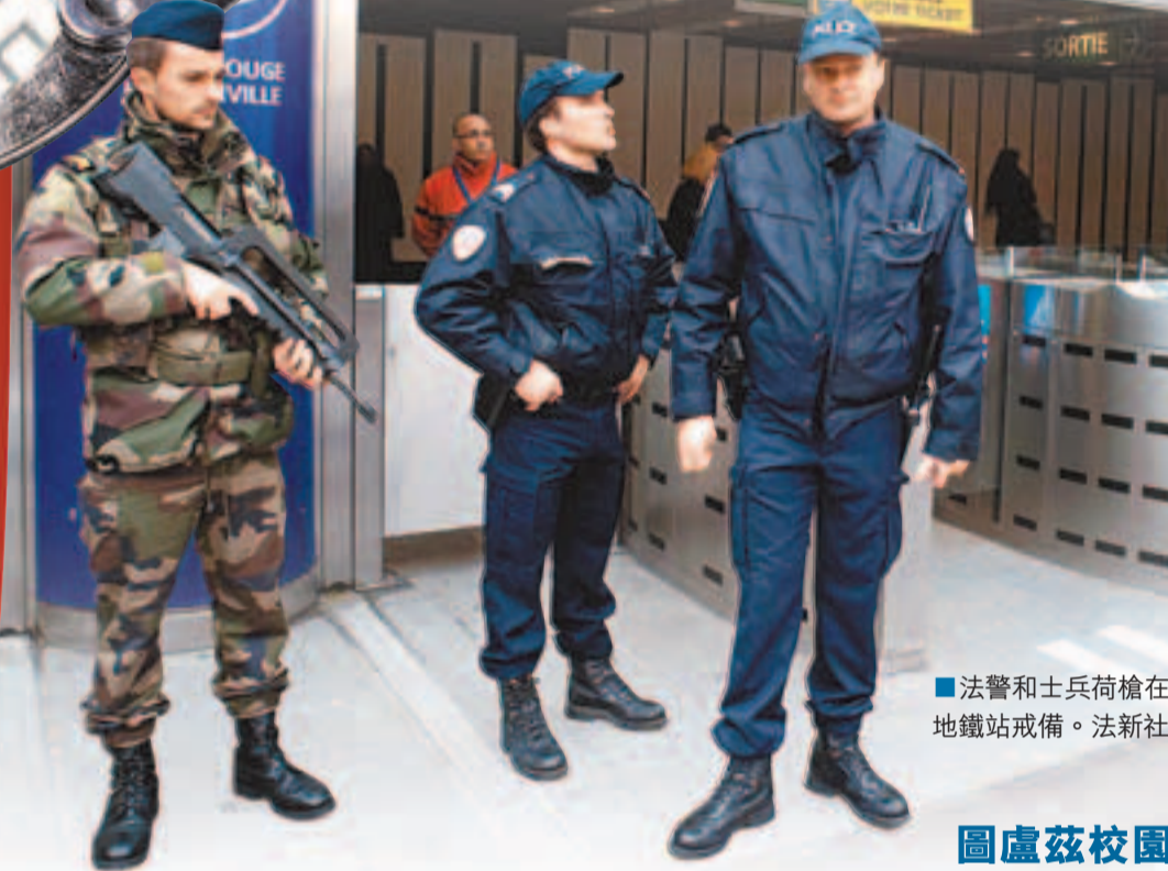
■法警和士兵荷槍在地鐵站戒備。

法國圖盧茲前日的猶太學校槍擊案，4名師生慘死，一名17歲學生情況仍然嚴重，慘劇震驚全國。案發的南部比利牛斯大區，保安警戒級別升至最高的紅色，警方動員數千人全力緝兇，圖盧茲儼如被「鎖城」。當局認為事件牽涉反猶太情緒，相信鐵騎槍手可能是極端種族主義者，當地傳媒更稱，事件可能與2008年因捲入新納粹運動而被開除的3名法兵有關。