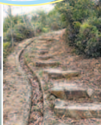
海灣兩邊的石級小道更是登高的好去處

於東涌巴士總站乘3、13、A38號巴士於貝澳新圍村下車，車程約35分鐘。 於中環港外線七號碼頭乘渡輪往梅窩，再乘1號巴士前往貝澳，車程約5分鐘。