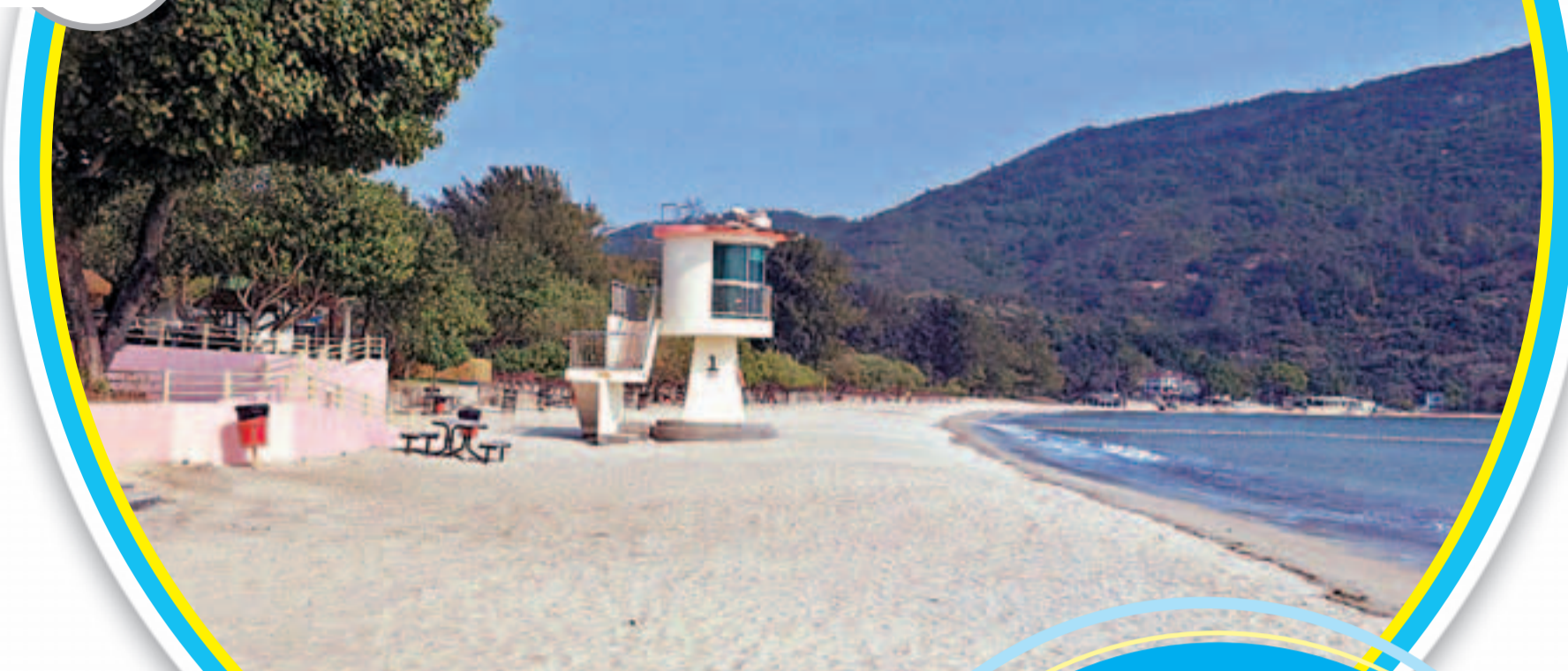
時常可以見到水牛在沙灘散步

貝澳位於大嶼山東南方，是大嶼山的南岸。貝澳東為芝麻灣，南為貝澳灣(海灣)，西為長沙，北為南大嶼郊野公園。貝澳是一個沙咀，幾條小河由附近的山流入海，或流入石壁水塘，其中一條大的是由向梅窩的山谷流入貝澳灣。海水和河水形成鹹淡水交界的地形和生態，海邊沖積一個螺子形狀的海灘。