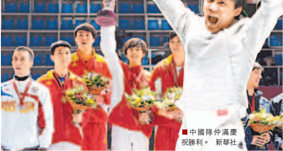
中國隊仲滿慶祝勝利。