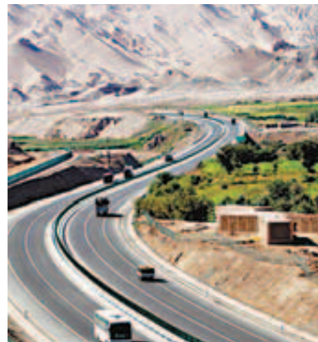
新疆連霍幹線星峽—吐魯番高速公路。

資料顯示,截至2011年底,新疆在建高速大道里程已達到3,425公里,通車高速大道里程由2010年的843公里增至1,459公里。