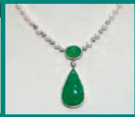
珍珠鑽石配翡翠，頸鍊顯得特別高貴。