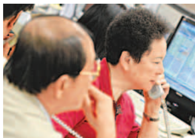
股市高位反覆，股民入市均抱戰戰兢兢心態。