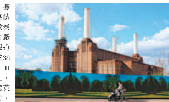
英國倫敦的巴特西發電廠。資料圖片

香港文匯報訊(記者 黃詩韻)據《星期日泰晤士報》消息，李嘉誠旗下的和系有意投標位於倫敦泰晤士河南岸的前巴特西發電廠(Battersea power station)項目。報道引述和記黃埔(0013)表示，對該38英畝範圍地段「非常有興趣」。而此地第一階段投標將於5月截止，估計競投會吸引約2.5億至3.5億英鎊資金。其他有意競逐的投標者，相信包括英國房屋建築商Berkeley Group Holdings Plc (BKG)，英國地產商British Land Co.，英國房地產投資信託公司Land Securities Group Plc等。巴特西發電廠是倫敦地標之一，於1983