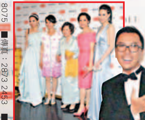
甄子丹與奇洛在紅毯上合影。