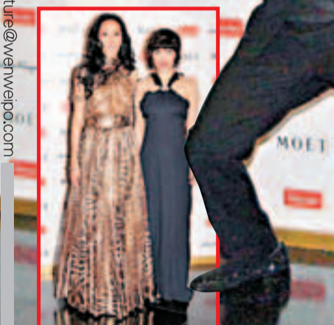
甄子丹的家人盛裝到場。