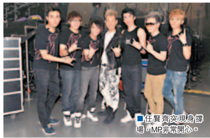
任賢齊現身撐場，MP非常開心。

香港文匯報訊(記者 吳文釗)台灣樂隊魔幻力量(MP)前晚於九展舉行一場《黑白初演唱會》，六位成員大玩搖滾音樂令台下觀眾興奮地站足全場，部分歌迷更高舉偶像最喜歡的紫色螢光棒。為配合在港演出，MP事前秘密苦練廣東歌，分別獻唱《想你》及《極速傳說》帶起全場高潮，唱到歌詞「頭搖又尾擺」時，團長凱開更大跳搞笑舞蹈。MP的師兄任賢齊以神秘嘉賓身份出場，為六位成員帶來驚喜，凱開對小齊的現身支持感動落淚。完