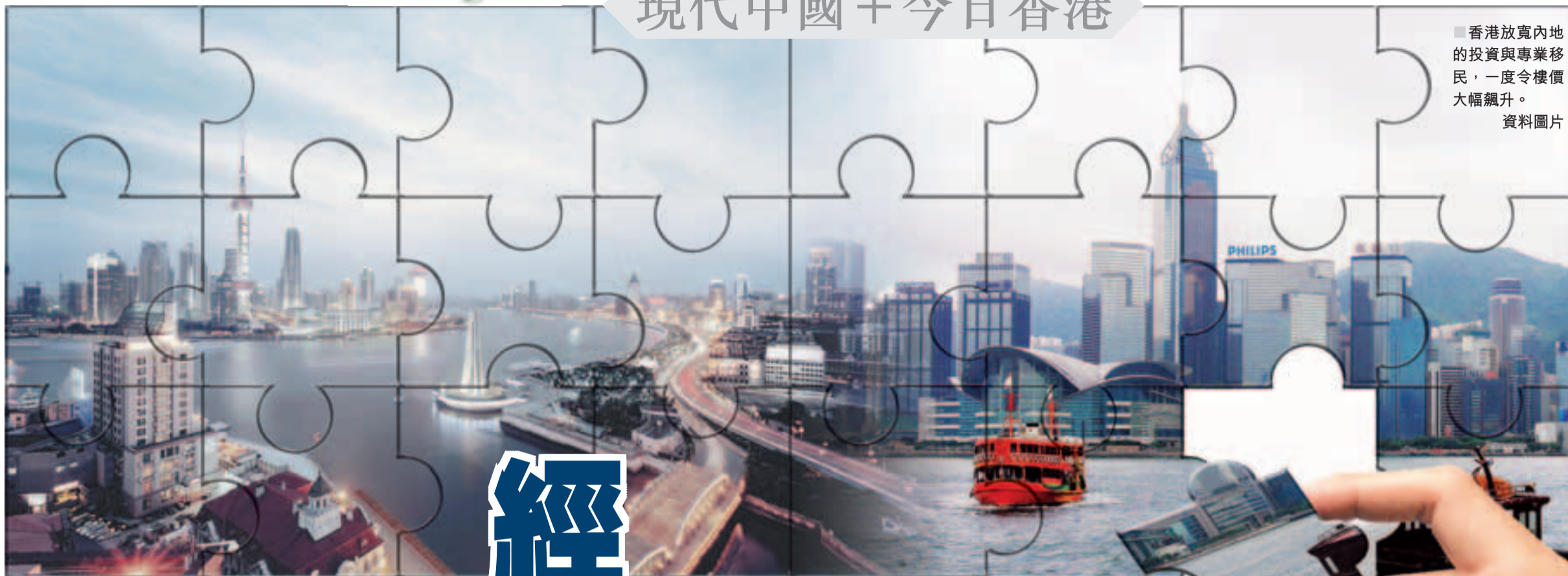
■香港放寬內地的投資與專業移民，一度令樓價大幅飆升。