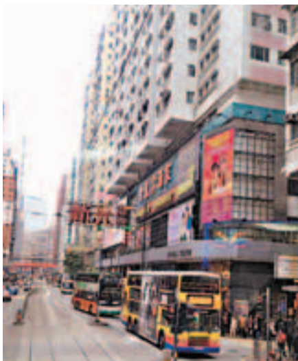
■內地資金湧港推高房地產價格，連「香港粵劇殿堂」新光戲院亦幾乎因未能支付昂貴租金而結業。

分困難。加上土地使用政策令私營醫療機構不易獲得土地開設新醫院、或擴充現有醫院的規模。故此，香港的醫療服務，難以配合內地孕婦往香港產子的上升趨勢。當孩子年紀稍大，可以永久居民身份入讀特區政府津貼學校以及享受各種社會福利。更有甚者，有報道指有內地父母以放棄在港出生孩子的撫養權，讓孩子獲取綜援。這些舉動令不少香港人認為「雙非嬰兒」正在蠶食香港社會福利。部分香港網民，更以含歧視成分詞語形容內地人對香港的挑戰。內地人亦因香港網民的謾罵，在網上對香港作出不可客氣的批評。互相攻擊之烈，就連國際時事雜誌《經濟學人》也有報道。