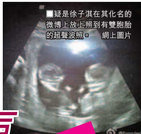
疑是徐子淇在化名的微博上放上照到有雙胞胎的超聲波照。