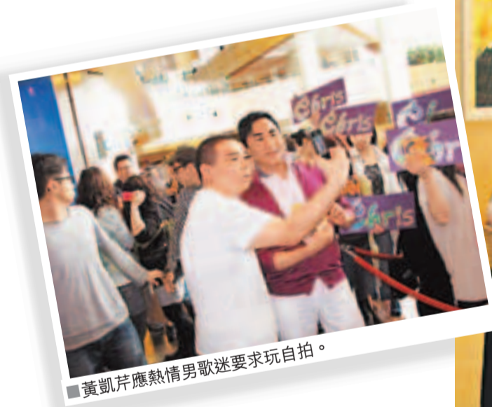
黃凱芹應熱情男歌迷要求玩自拍。