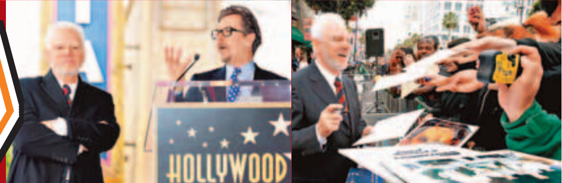
加利(右)致辭時，馬康細心聆聽。