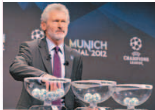
■前德國球星畢烈拿主持抽籤。

艾比度雖然出生於里昂，但早年並非一開始就效力大球會里昂，而是先出身於另一支球會摩納哥，之後效力里爾，到2004年才轉投里昂。里昂自2001年起已連贏六屆法甲冠軍，其中2004-05、2005-06、2006-07年三屆，艾比度也參與其中。 艾比度早於2004年已入選國家隊出賽，2006年世界盃他上陣所有決賽周賽事，包括打入決賽的一場，惜在互射十二碼中不敵意大利。該屆世界盃艾比度表現出色，故及後受到各國大球會招攬，包括曼聯和皇家馬德里。2007年6月28日，艾比度宣佈與巴塞達成協議，以1500萬歐元轉投該支西班牙勁旅，與球會簽約4年，年薪達二百萬歐元，穿上22號球衣。