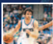
■NBA木狼隊球星盧比奧亦送上祝福。