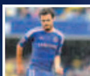
■效力車路士的馬達祝願艾比度早康復。

出生日期 1979年9月11日 (32歲) 出生地點 法國里昂 身高 1.86公尺 位置 左閘 球會資料 巴塞羅那 球衣號碼 22 職業球會 2000-02 摩納哥 2002-04 里爾 2004-07 里昂 2007- 巴塞羅那 國家隊 2004 - 法國 個人榮譽 里昂 法甲聯賽冠軍：2004-05、 2005-06、2006-07 法國超級盃冠軍：2005、 2006、2007 巴塞羅那 西甲聯賽冠軍：2008/09、 2009/10 西班牙盃冠軍：2008/2009 歐聯冠軍：2008/09、 2010/11 西班牙超級盃冠軍：2009 歐洲超級盃冠軍：2009 世界冠軍球會盃冠軍： 2009 個人 歐洲足協年度最佳陣容： 2007