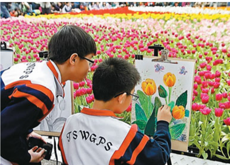
2012年香港花卉展覽昨日在維多利亞公園開幕，展出超過35萬株花卉，吸引大批市民入場欣賞。

今年花卉展覽為期10天，展期直至本月25日，「主題花」是風信子，展覽主題則為「花之旅」。會場內鋪設的花毯由糖街入口延伸至興發街，花毯內加插世界各地的旅遊景物，如南極洲的企鵝和中國的萬里長城等元素，與「花之旅」主題互相呼應，展品「花花世界」，更由16,000株花卉組成。花卉展入場費，成人14元，小童、學生、60歲以上長者、殘疾人士及照顧者半價。星期一至五，長者、殘疾人士及照顧者可免費入場。