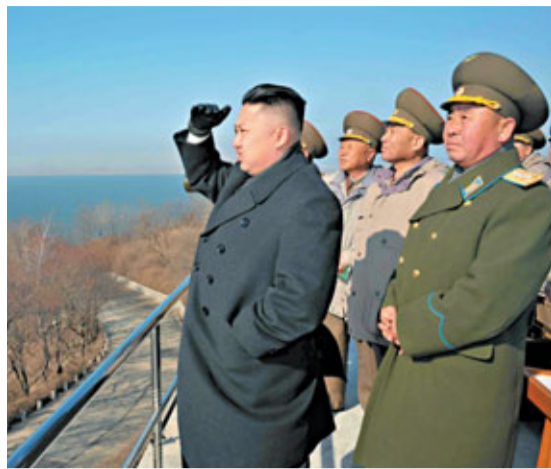
金正恩視察朝鮮人民軍三軍聯合射擊訓練。