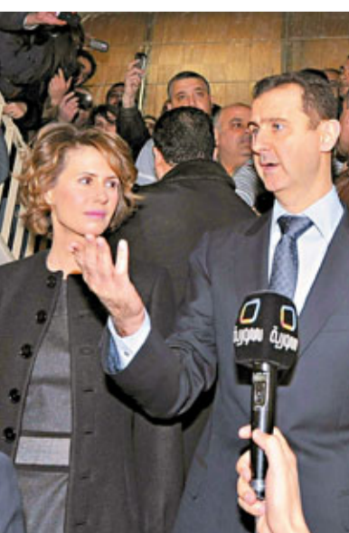
巴沙爾(右)的軍師據稱正是妻子阿斯馬(左)的父親。

敘利亞反對派領袖巴沙爾(右)與妻子阿斯馬(左)的父親。敘利亞反對派領袖巴沙爾(右)與妻子阿斯馬(左)的父親。敘利亞反對派領袖巴沙爾(右)與妻子阿斯馬(左)的父親。