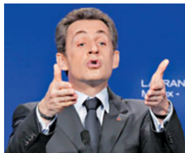
法國總統薩科齊。

奧朗德同日在電視中承諾，令法國在2017年達收支平衡。他稱保證增長應先於緊縮，故會否決削減。他表示，應把增長重新帶回歐洲，更稱「德國不應獨自決定歐洲的方向」。他亦提出增收針對有錢人的「團結」稅項，向收入達100萬歐元(約1,015萬港元)的富人收取75%稅率。