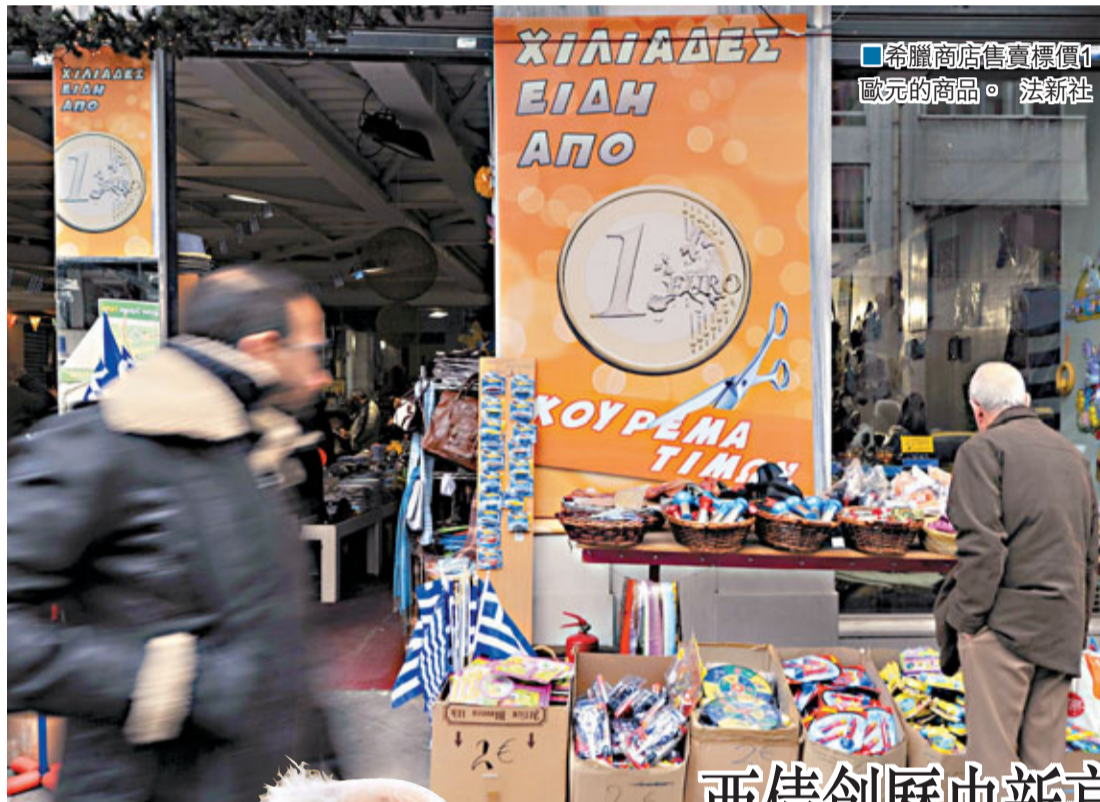
希臘商店售賣標價1歐元的商品。