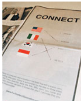
美國《紐約時報》刊登的廣告，內容指竹島(韓稱獨島)是韓國的領土。日本駐紐約總領事館稱，該廣告利用媒體公信力，可能會誤導讀者，因此向《紐時》抗議。

另外，日本政府昨日於內閣會議上通過一份答辯書，其中就Google地圖將竹島標註為韓國島嶼一事稱，已多次要求Google修正。日方稱對標註「無法接受」，今後將繼續研究有效對策。