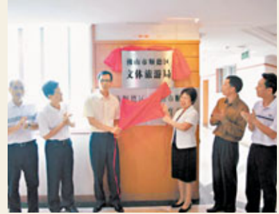
順德新組建的區文體旅遊局揭牌現場。