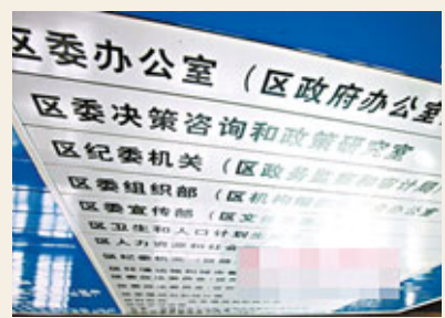
順德區政府大廳裡的新索引牌。