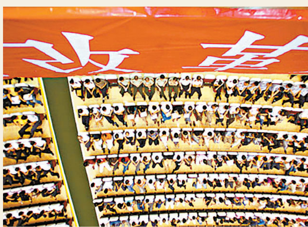
順德區黨政機構改革動員大會會場。

據悉，「局務委員」職務是順德區首創。當時順德進行「大部制」改革，其中一條原則就是平穩過渡，「不裁撤一個人，不降一個官」。為此，在撤併部門過程中，由區委常委或副區長擔任正局長，而合併前數個局的正副局長可能多達十幾人，為了給這些官員一個去處，專門設立了一個叫「局務委員」虛職，他們不擔任具體職務，但享受副局長待遇。