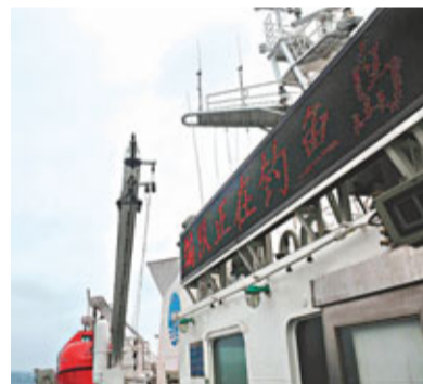
16日清晨5時許，中國海監定期巡航編隊，抵達釣魚島及其附屬島嶼附近海域進行巡航。

中國外交部發言人劉為民表示，釣魚島及其附屬島嶼自古以來就是中國的固有領土，中國對此擁有無可爭辯的主權。日方無權在釣魚島海域執行任何「公務」，日方對中國公民採取任何形式的所謂司法程序都是非法和無效的。