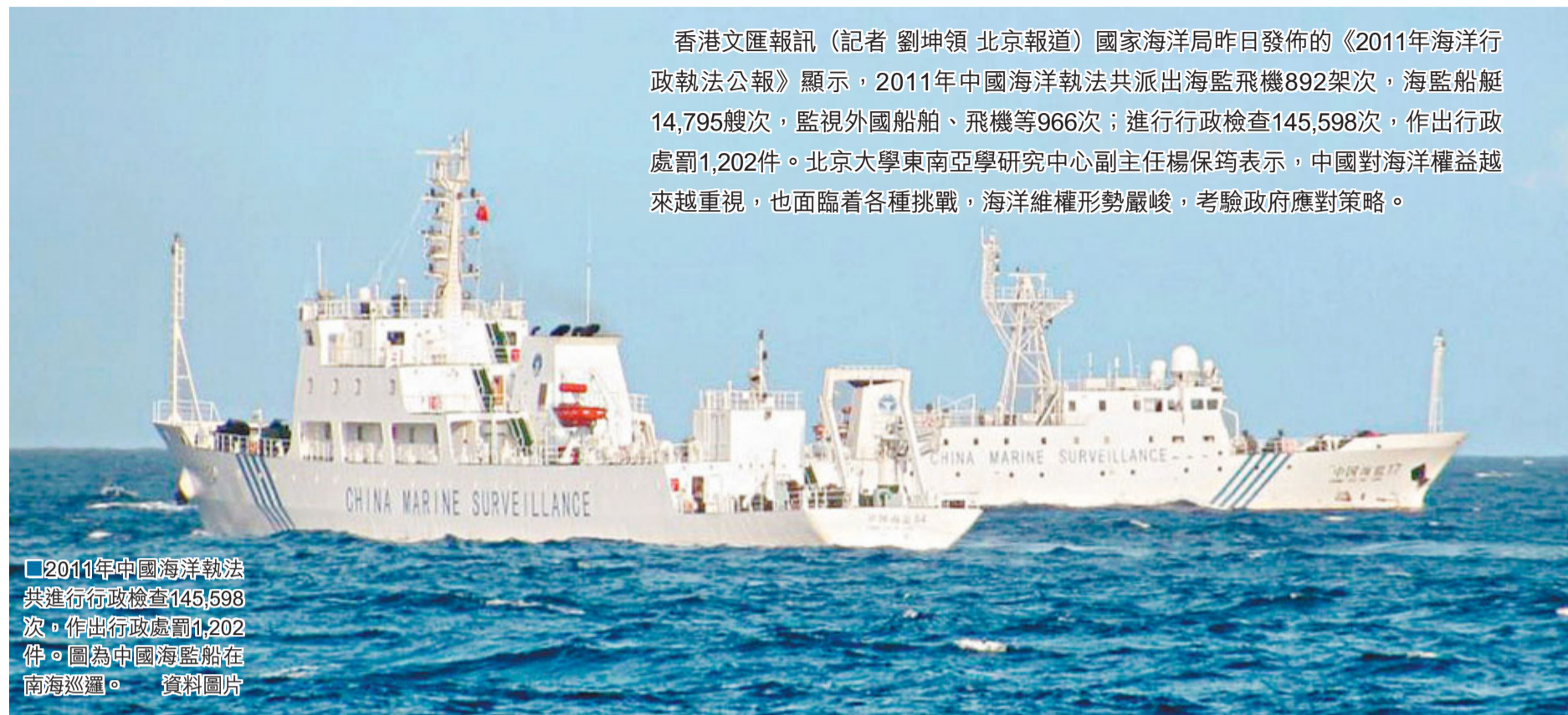
2011年中國海洋執法共進行行政檢查145,598次，作出行政處罰1,202件。圖為中國海監船在南海巡邏。

香港文匯報訊（記者 劉坤領 北京報導）國家海洋局昨日發佈的《2011年海洋行政執法公報》顯示，2011年中國海洋執法共派出海監飛機892架次，海監船艇14,795艘次，監視外國船舶、飛機等966次；進行行政檢查145,598次，作出行政處罰1,202件。北京大學東南亞學研究中心副主任楊保鈞表示，中國對海洋權益越來越重視，也面臨各種挑戰，海洋維權形勢嚴峻，考驗政府應對策略。