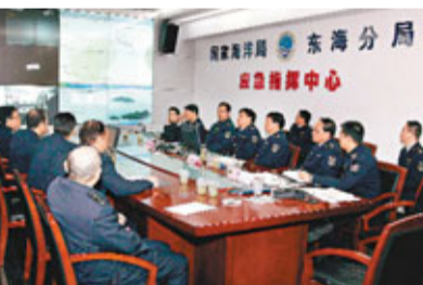
國家海洋局東海分局應急指揮中心現場大屏幕正在顯示中國海監船的巡邏情況。

在今年的全國兩會上，中國軍事科學學會常務理事兼副秘書長羅援少將提交了成立國家海岸警備隊應海上衝突的提案。羅援指出，鑒於目前中國東海、南海形勢日趨複雜、嚴峻，我們需要成立一個在領海內巡航的綜合執法力量。海岸警備隊可為中國的外交與軍事鬥爭留下迴旋餘地。當摩擦發生時，由海岸警備隊率先出面，因為它是一支「準軍事部隊」，不至於讓一些海事問題直接升級為軍事衝突。而海軍則作為它的堅強後盾，一旦矛盾激化，則可以重拳出擊。