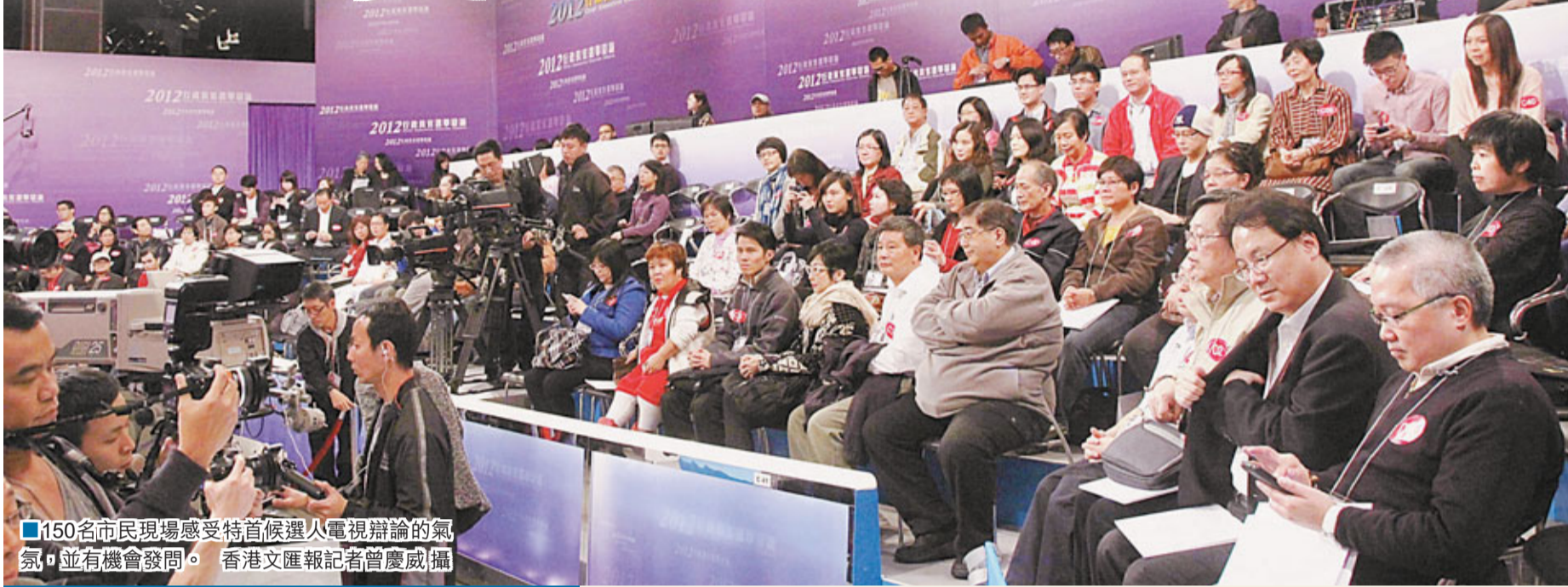
150名市民現場感受特首候選人電視辯論的氣氛，並有機會發問。

香港文匯報訊 香港多間電子傳媒委託中大傳播研究中心所做的行政長官選舉辯論即時民意調查顯示，最多受訪者認為梁振英在辯論中的表現最好，佔總數的43.7%。