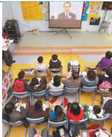
一群青少年集體收看特首候選人電視辯論，並為候選人的表現評分。香港文匯報記者黃偉邦攝

另外，三名候選人在論壇結束後離開時，均一度被示威者包圍，場面一度混亂，最終各候選人在警方護送下始能離開現場。香港文匯報記者 鄭治祖