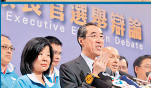
辯論結束後，梁振英（上）、唐英年（下）舉行記者會。