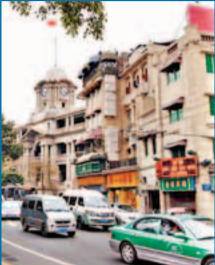
今日長堤一帶舊建築仍在，但昔日金融街風采已蕩然無存。

改革開放後的長堤金融街因港商北上更為興盛。大公餐廳、人人菜館、大三元酒樓成為中國最早「中港合資」企業，西濠二馬路一帶被稱為「小香港」。不過，上世紀90年代始，廣州城市中心開始向天河東移，長堤商圈始走下坡。老字號大三元酒家、大公餐廳、海珠大戲院等也先後倒閉。