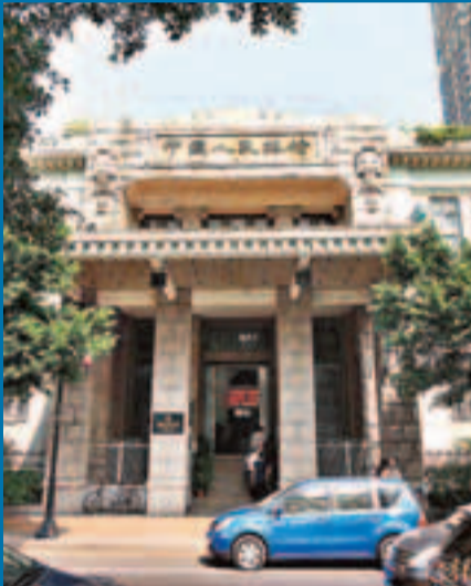
孫中山1924年創辦的中央銀行舊址。該址曾為中國人民銀行分行。網上圖片