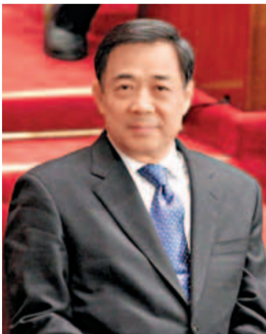
薄熙來不再兼任重慶市委書記、常委、委員職務。

鮮去職；1995年，中央政治局委員、中紀委第一書記尉健行兼任北京市委書記，陳希同引咎辭職；2003年，中央政治局委員、國務院副總理吳儀兼任衛生部部長，張文康因闢報沙士疫情被免職。竹立家並指出，李源潮的講話表明，這次重慶市委主要領導調整是鑒於王立軍事件造成的嚴重政治影響，顯示薄熙來去職重慶，是對王立軍事件負責任。但迄今中央未對薄熙來的去向作進一步說明，其政治局委員的身份也依然保留，因此，以既往案例類比此次重慶的人事調整，並主觀構想薄熙來的政治前途，也許並不恰當。