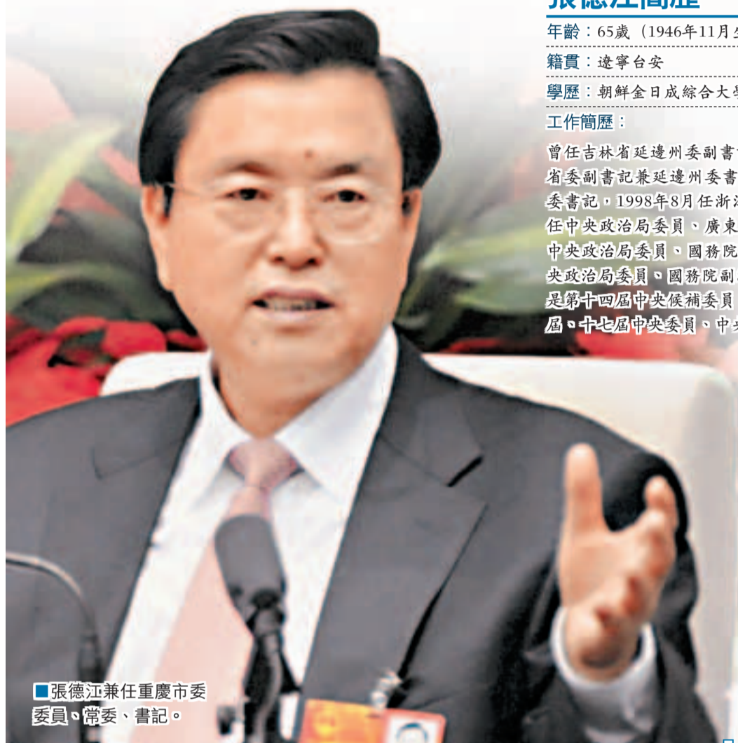
張德江兼任重慶市委委員、常委、書記。

年齡： 65歲（1946年11月生） 籍貫： 遼寧台安 學歷： 朝鮮金日成綜合大學經濟系畢業，大學學歷 工作簡歷： 曾任吉林省延邊州副書記，民政部副部長，吉林省委副書記兼延邊州委書記，1995年6月任吉林省委書記，1998年8月任浙江省委書記，2002年11月任中央政治局委員、廣東省委書記，2008年3月任中央政治局委員、國務院副總理，2012年3月任中央政治局委員、國務院副總理兼重慶市委書記。是第十四屆中央候補委員、十五屆中央委員，十六屆、十七屆中央委員、中央政治局委員。