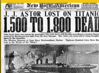
當年英美多份報紙報道這件重大事故。

還記得傑克與羅絲在鐵達尼號相遇的愛情故事嗎？那句「You jump, I jump」讓無數戀人嚮往不已，每年情人節，他們浪漫的愛情故事一次又一次在電視熒幕上播放。今年是鐵達尼號沉船一百周年，也是電影《鐵達尼號》(Titanic) 載譽歸來的日子，3D版本的《鐵達尼號》將帶領觀眾走入如幻似真的豪華郵輪，體驗海浪迎面撲來的驚險歷程。