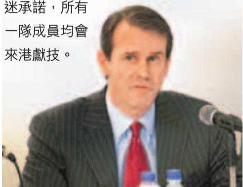
阿仙奴商務總監霍湯姆向香港球迷寫包單。

香港文匯報訊(記者 郭正謙) 英超勁旅阿仙奴7月強陣襲港!上屆港甲冠軍傑志將於7月29日於香港大球場迎戰阿仙奴，這支英超勁旅昨日派遣名宿基昂陪同一班球會高層來港出席記招以示誠意，阿仙奴商務總監霍湯姆更向廣大球迷承諾，所有一隊成員均會來港獻技。