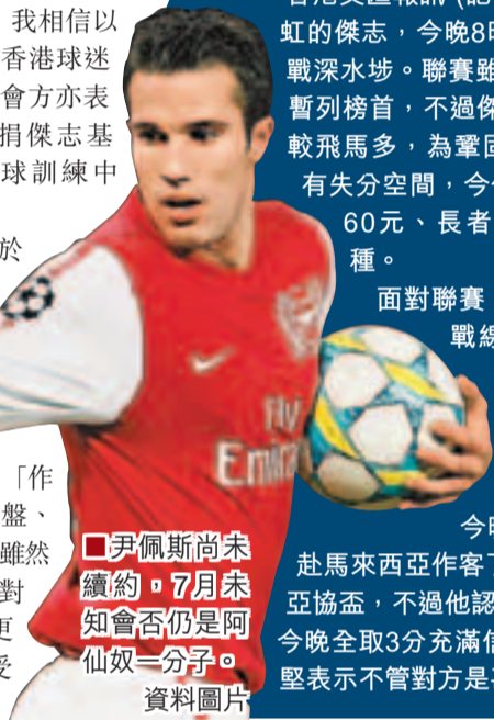
尹佩斯尚未續約，7月未知是否仍是阿仙奴一分子。