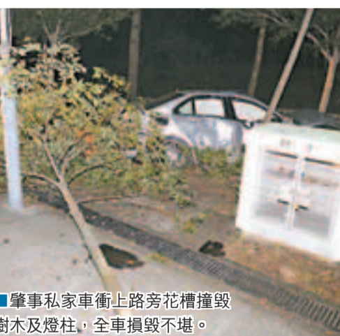
肇事私家車衝上路旁花槽撞毀樹木及燈柱，全車損毀不堪。