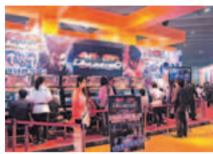
2012廣州國際網絡及數字互動遊戲博覽會吸引不少玩家體驗遊戲。

香港文匯報訊（記者 古寧 廣州報導）在日前舉行的2012廣州國際網絡及數字互動遊戲博覽會上，有業界人士表示，在遊戲產品的生產研發領域，廣東是內地網絡及數字互動遊戲產業重要基地，去年廣東省網絡文化及相關數字互動遊戲產業年收入佔全國三分之一，居全國第一。同期，廣東網絡遊戲總產值達250億元。 據主辦方介紹，是次展會第一次舉辦就以6萬平方米的展出面積，成為華南歷屆類似展會中規模最大的展會。包括網絡遊戲、數字互動遊戲(大型街機遊戲)、移動手機遊戲、動畫漫畫集體亮相，展會現場還有150款最新網絡遊戲、約1,500款最新電玩遊戲及超過30場目前最流行最時尚的動漫活動，提供觀眾現場遊戲體驗。 除內地展商外，本次參展的國外展商