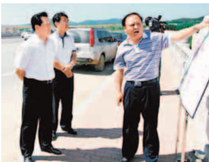
金州新區黨工委書記、管委會主任徐長元（左一）視察產業項目。

香港文匯報訊（記者 齊曉玖、毛絮薇 遼寧報道）大連金州新區37個產業和基礎設施重點項目日前同時開工，計劃總投資逾600億元（人民幣，下同），涵蓋生物醫藥、裝備製造、文化旅遊、基礎設施配套等推動區域發展的支柱產業。金州新區黨工委書記、管委會主任徐長元接受本報記者專訪時表示，金州新區將以低碳、環保、綠色、可持續作為產業發展和園區建設的基本前提，抓住國際產業轉移機遇，以十大功能園區為載體，承接大連及東北地區產業升級改造，做大產業規模，引領戰略性新興產業發展，打造世界級現代產業集聚區。