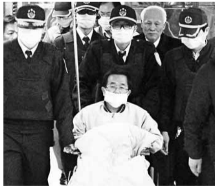
暗鬥的多事之秋，阿扁被視為代表美麗島時代舊勢力的「精神象徵」，與力推世代交替、高呼改革的蔡英文等新一代領袖實已貌合神離。陳星預料，陳水扁未來仍將繼續與民進黨進行多場連續博奕，「後面的戲還有得瞧」。

陳星認為，雖然陳水扁身在獄中，但以其為尊的「一邊一國連線」目前握有7席「立委」，加上一些縣議員，已形成一股令民進黨甚為忌憚的「盟友勢力」；他可利用「一邊一國連線」的勢力，繼續保持他對民進黨的影響力。分析指出，民進黨時逢世代交替、權力