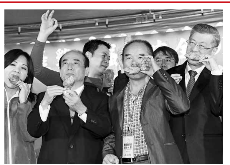
陳冲(右)、王金平(左二)大啖雞腿，身體力行挽回島內肉類的信心。

香港文匯報訊 台灣爆發H5N2高病原性禽流感疫情，引發民眾消費恐慌，雞肉及蛋價大幅下滑。為搶救雞價，台灣養雞協會13日在「立法院」宣佈凍存40萬隻雞，以穩定市場價格。台灣「行政院長」陳冲、「立法院長」王金平等人在場大啖雞肉，呼籲民眾安心吃雞肉和雞蛋。