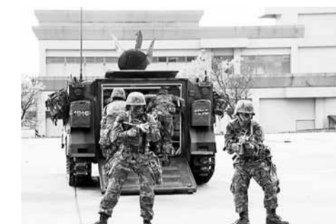
運輸車在去年漢光演習出動。資料圖片

在漢光28號演習方面，軍方指出，演習區分為「實兵演練」及「電腦輔助指揮所演練」兩階段。實兵演練將於4月16日至20日登場，其中聯興(聯合兩棲登陸)、聯雲(聯合空降及反空降作戰)與跨區增援3項