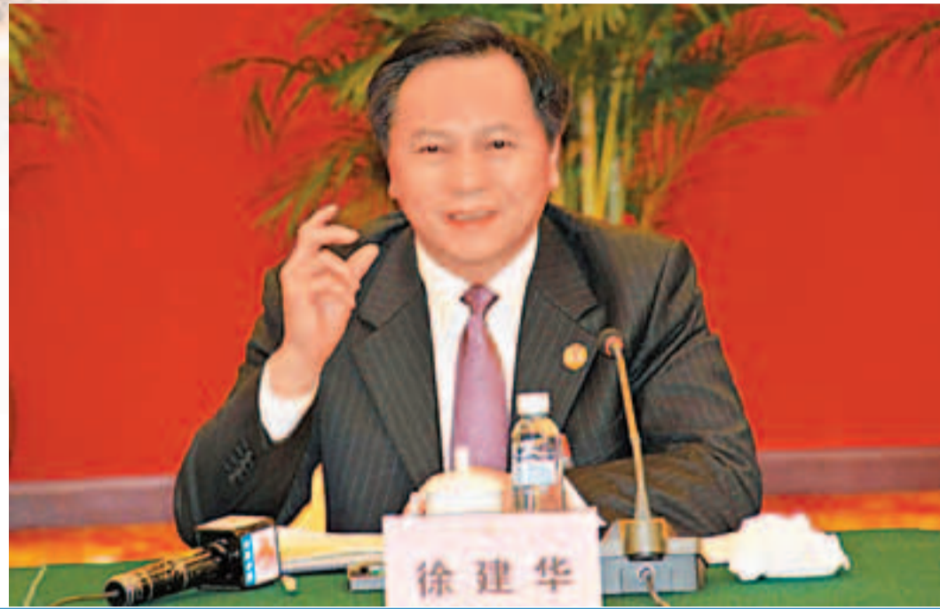
■東莞市委書記、市人大主任徐建華說，東莞過去30多年的快速發展，靠的是改革開放；東莞未來實現高水平崛起，仍然必須靠改革開放。