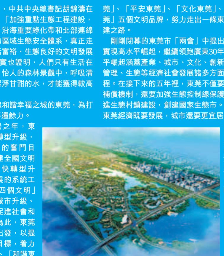
■東莞生態園發展定位為濱海生態園，高標準發展及配套设施建設。圖為東莞生態園鳥瞰圖。

一直以來，創建和諧幸福之城的東莞，為打造宜居生態之城不遺餘力。「十二五」開局之年，東莞確立了「加快轉型升級，建設幸福東莞」的奮鬥目標。持續深入創建全國文明城市，不僅是加快轉型升級、推動科學發展的系統工程，還是促進「四個文明」協調發展、推動城市升級、增進民生福祉、促進社會和諧的民心工程。為此，東莞堅持從群眾利益出發，以提高人民幸福為目標，着力打造「人文東莞」、「和諧東