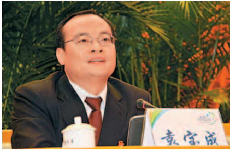
■東莞市委副書記、市長袁宗成表示，未來的五年，東莞會以加快轉型升級、打造創新型經濟為重點，努力把東莞打造為全省科技和產業融合發展的示範區、結構調整和轉型升級的樣板區。