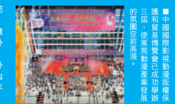
■中國國際影視動漫版權保護和貿易博覽會成功舉辦的氛圍空前高漲。

據了解，從今年開始，東莞每年將拿出10億元連續5年打造文化名城。10億，這也引發了外界對東莞文化名城的諸多猜想，資本撬動下，東莞大力引進精品音樂劇、音樂頒獎典禮等外來文化，鋪設出東莞文化表面的繁榮。而「內生文化」萌發，也意味着東莞文化在新的一年開始「自我造血」。