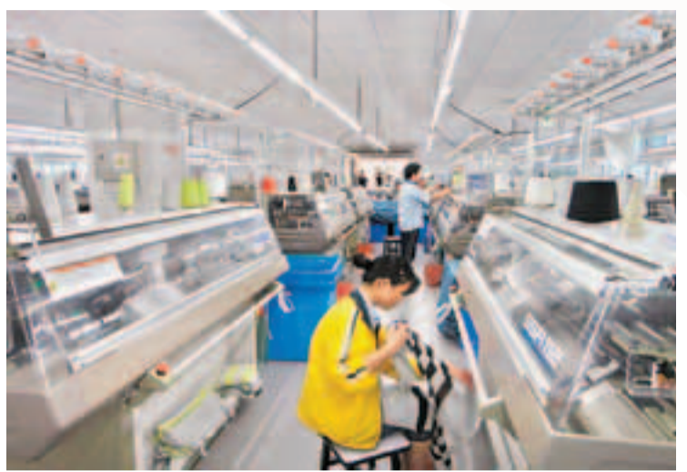
■東莞加工貿易轉型升級，最具突破性的就是成功摸索出一條來料加工企業「不停產轉型」的模式。

儘管如此，未來的五年，轉型仍是東莞不變的主題。東莞會以轉創新型經濟發展方式為主線，以加快轉型升級、打造創新型經濟為重點，努力把東莞打造為全省科技和產業融合發展的示範區、結構調整和轉型升級的樣板區。