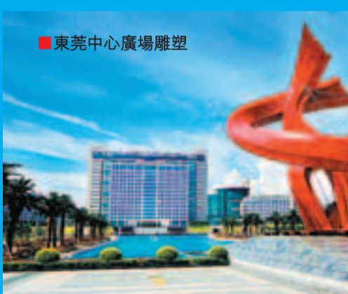
■東莞中心廣場雕塑

近年來，東莞把城市建設作為推動經濟社會發展的強大載體，堅持高起點規劃、高標準建設、高水平管理，城市形象得到了明顯提升，城市功能日臻完善。相信不少東莞人都有這樣的感受：工業化發展逐漸成為的東莞，步調變得從容，生態休閒的生活氛圍引領着城市的發展。「中國最佳魅力城市」、「國家衛生城市」、「全國綠化模範城市」、「國家園林城市」、「國際花園城市」、「全國文明城市」、「國家環保模範城市」……一張張嶄新的名片，更地面地展示着一個現代化的東莞。但是東莞人創建幸福之城的腳步並未就此停滯。新一屆東莞市委、市政府又提出了提升「市區首位度」的發展目標。所謂市區首位度，即「十二五」開啟後，東莞在城市規劃建