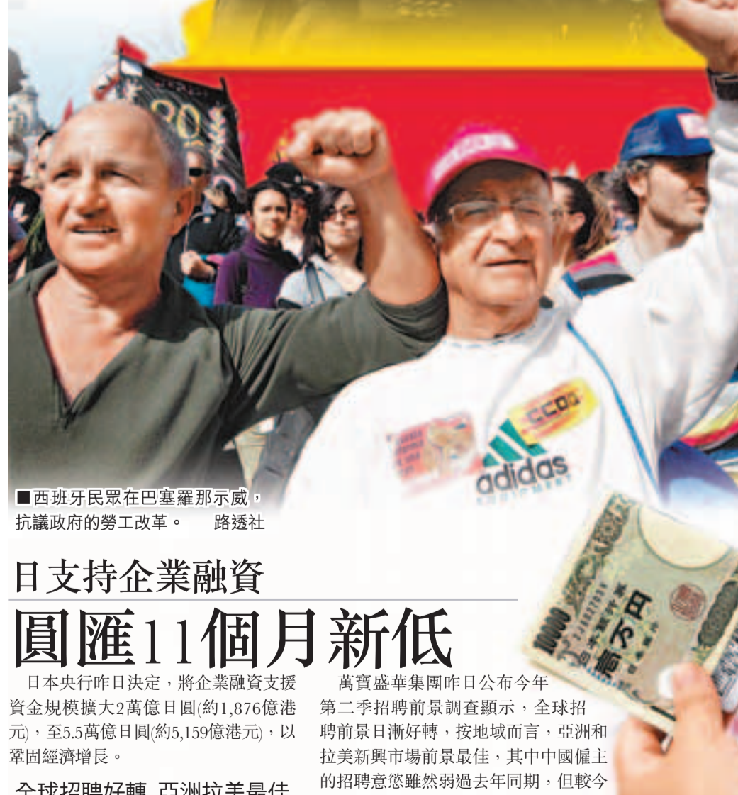
■西班牙民眾在巴塞羅那示威，抗議政府的勞工改革。