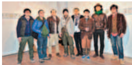
■「80後」新生代藝術家共同詮釋「2012」