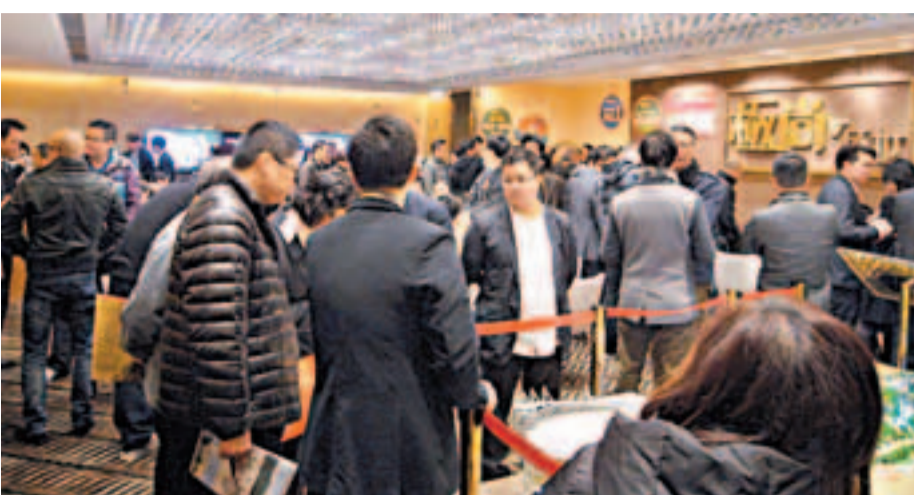
一、二手市場自春節後趨旺,吸引銀行重新積極參與按揭市場。

事實上,銀行按揭暗戰已引起金管局關注,金管局發言人稱,有需要時會向個別銀行了解其按息水平是否能反映當中的風險,該局向來有要求銀行審慎管理物業按揭貸款業務的風險,並在釐定按揭息率時