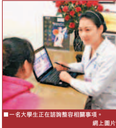
一名大學生正在諮詢整容相關事項。

不久前有外報報導稱，中國有望成為繼美國和巴西之後全球第三整容大國。有數據顯示，儘管韓國美容機構針對中國遊客的手術收費是韓國人的兩三倍，2011年公開申請醫療簽證赴韓的中國遊客仍高達1073人。