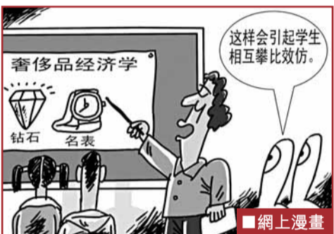
這會引起學生相互攀比效仿。網上漫畫

有家長則認為，這門選修課對高中生來說太深了，是把雙刃劍。現在的很多孩子崇拜品牌，擔心孩子本是單純為了解奢侈品而選課，反而陷入奢侈品盲目崇拜的洪流中。