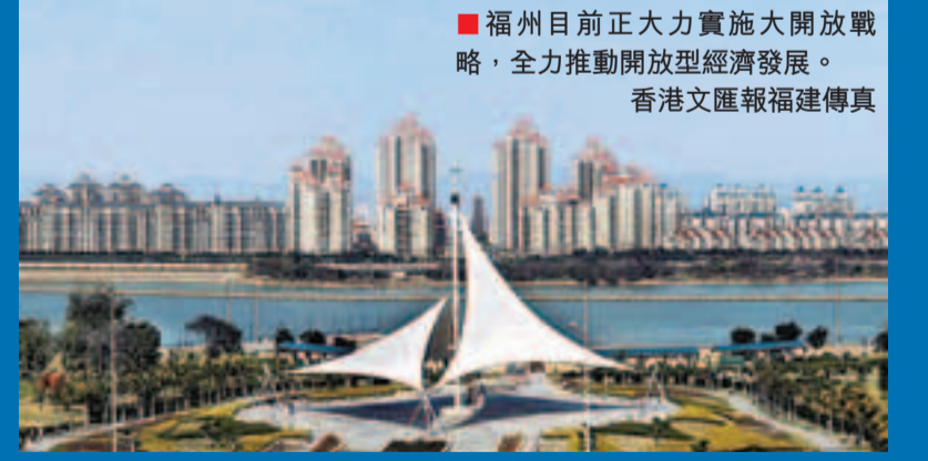
■福州目前正大力實施大開放戰略，全力推動開放型經濟發展。 香港文匯報 福建傳真

據了解，楊岳此前與國內民營企業家談話時也強調，福州將圍繞實施大開放戰略，發展開放型經濟，力求在精簡審批事項、減少審批環節，提高服務效率、優化服務環境上取得顯著提升，吸引更多的先進生產要素匯聚福州，讓更多的民營企業在福州迸發活力、茁壯成長、做大做強。