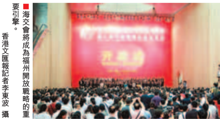
■海交會將成為福州開放戰略的重要引擎。

此外，去年，福州市利用外資質量與規模不斷提高，新批准外商投資企業170家，合同外資17.70億美元，實際到資12.77億美元，取得歷史最好水平；全年累計完成進出口總值347.25億美元，其中，外貿出口在逆勢中大幅增長，首次突破200億美元大關，實現出口總值241.31億美元，比增47.91%，出口增幅居全省第一位。