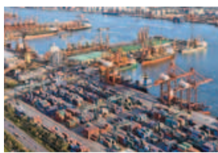
天津港去年貨物吞吐量,在中國內地排名第三、世界排名第四。

據介紹,2011年,天津港集裝箱吞吐量完成1150萬標箱,全年共完成固定資產投資135億元人民幣,新開發集裝箱航線13條,焦炭、外貿鋼材、原木等貨類吞吐量實現較大幅度增長,海鐵聯運班列線路已達15條。通過「無水港」的建設,天津港已經輻射到佔中國面積52%的14個省、市、自治區,70%的貨物吞吐量和50%以上的口岸進出口貨值來自天津以外。