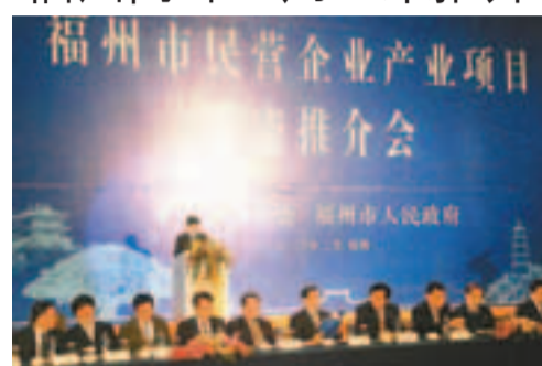
福州早前赴深圳推介投資機遇。